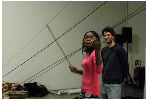
Atelier rotoscopie - Nyktalop Mélodie, Le Lieu Multiple, Le Générateur